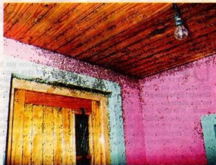
HASTA EN EL TECHO. LOS MILES DE INSECTOS COPAN TODOS LOS RINCONES.

Según aseguran los vecinos tocaron las puertas de todos los intendentes anteriores. Ahora encontraron eco en el actual jefe